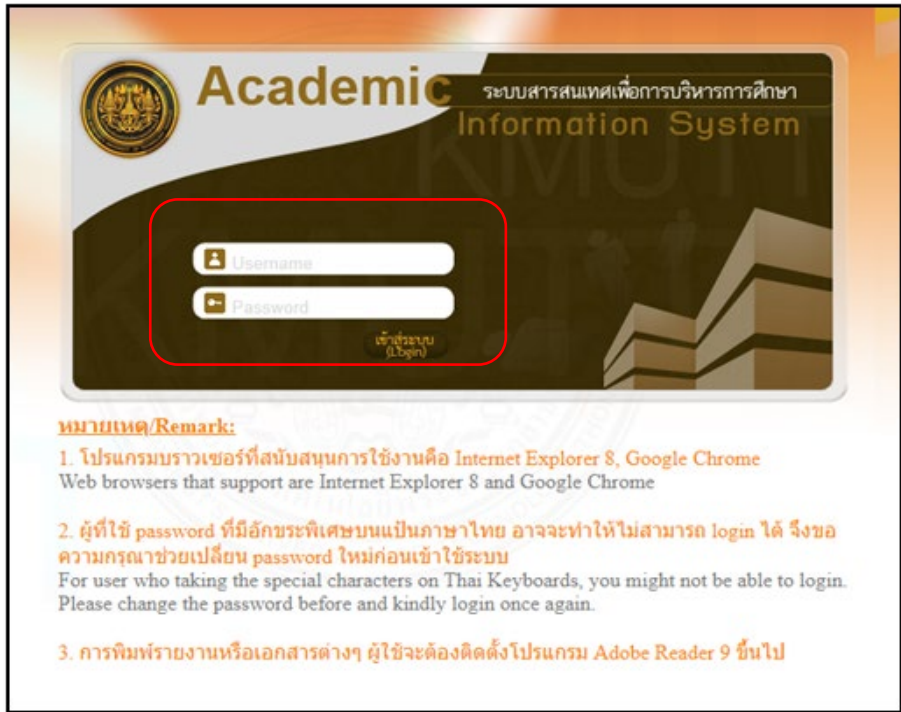
ภาพที่ 1 ระบุรหัสเข้าระบบ

จะปรากฏหน้าจอให้ผู้ใช้งานระบุ Username และ Password ดังภาพที่ 1